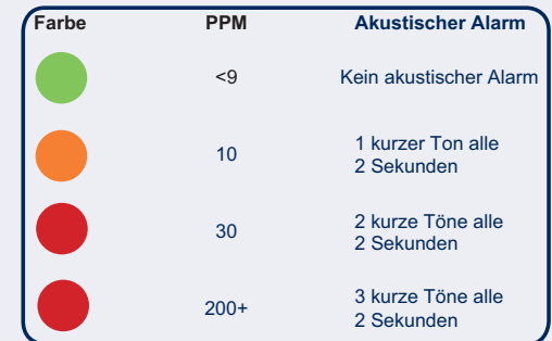
Tabelle Expositionsdauer und CO-Gehalt der Luft (ExD/CO)